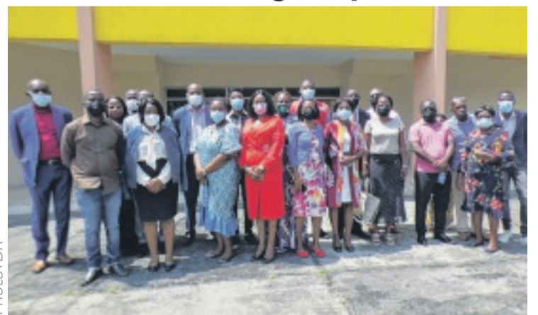
L'objectif de l'atelier, mettre fin aux violences en milieu scolaire.

Cette rencontre initiée par la direction générale des œuvres scolaires fait suite à une classification des messages par cible et consiste à examiner les résultats et les recommandations de l'enquête sur les violences en milieu scolaire. Mais surtout définir le niveau de communication, proposer des messages de sensibilisation pour enfin valider en plénière ces messages et les stabiliser. Selon la DGA des œuvres sco-