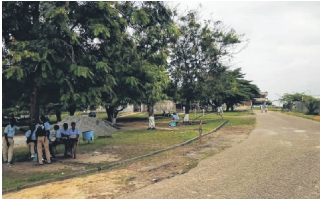
Les enseignants grévistes reprennent progressivement les cours comme ici au lycée technique Omar-Bongo d'Owendo.